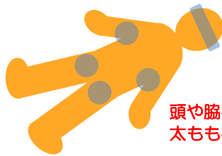
頭や脇の下 太もものつけね等を冷やす