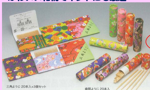
三角ようじ 20本入×3個セット