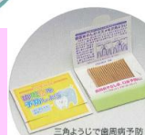
三角ようじで歯周病予防