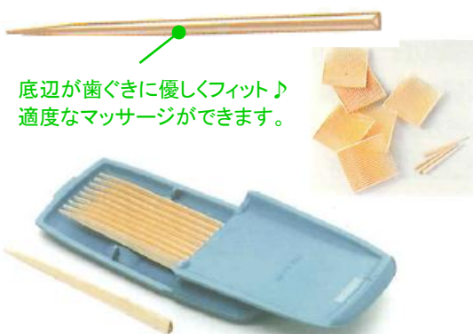
底辺が歯ぐきに優しくフィット♪ 適度なマッサージができます。